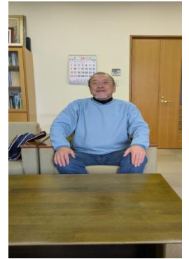
明朗快活にお答え いただいた東会長