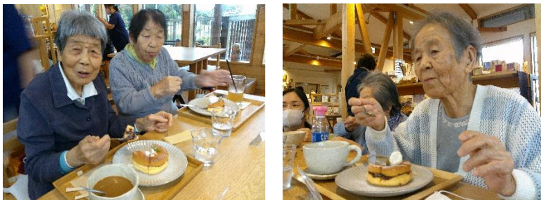
介護予防教室 令和6年12月のプログラム

10月24日(木)は、18名のご利用者様と、日笠町にあるカフェ「水仙月」へお食事に出かけました。木の匂いが香る明るい雰囲気のお店です。事前に頼んでいたケーキセットが運ばれてきて、動物の顔のパンケーキに癒されたり、飲み物のボリュームにびっくりしたりと楽しい時間でした。「食べきれるかしら」と言いながらも、美味しそうにペロりと完食されました。食後はじゃんけん大会で締めくくりです。デイサービスでは今後も様々な景色が見られる場所やお店に行き、一緒に思い出を作っていきたいと思えます。次はどこへ外出するのか、楽しみにしててくださいね。